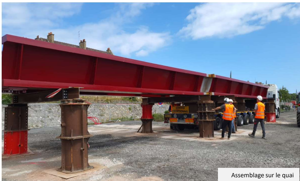
Assemblage sur le quai