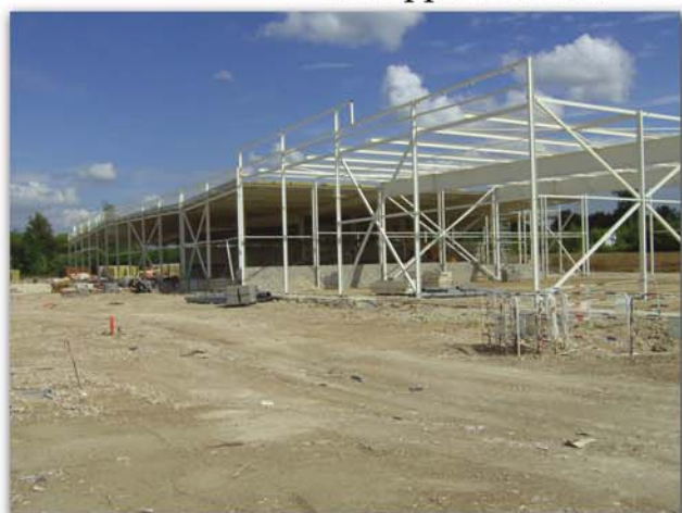
Montant estimé du lot : 200 000 euros H.T