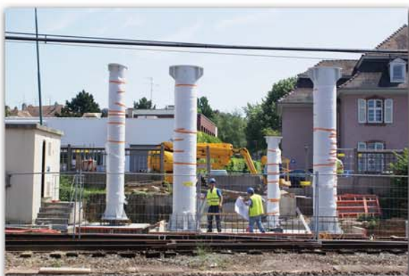
Passerelle de 47 m de long - 5,10 m de large 3,70 m de hauteur

L e chantier de la passerelle piétonne qui se déroulera à partir du 18 juillet sera un grand challenge pour nos équipes de montage : cet ouvrage devra être monté et soudé en un week end seulement, le chantier se trouvant de plus sur un Boulevard très fréquenté. Avant d'être livrés sur le chantier, les tronçons sont d'abord réalisés dans les ateliers Berthold ; les études ayant commencé en janvier. Cet ouvrage de 90 tonnes d'acier, sera ensuite assemblé et gruté sur place.