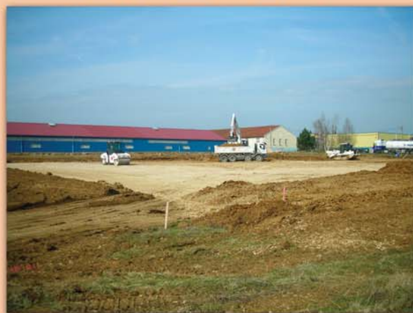
Réalisation de la plateforme