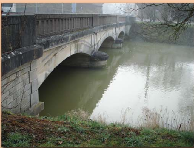
Début des travaux : février

E ncore deux mois avant que le pont sur le Rupt de Mad ne soit reconstruit. Cet ouvrage, de type passage supérieur à dalle béton armé possède trois travées et une portée de 33 m.