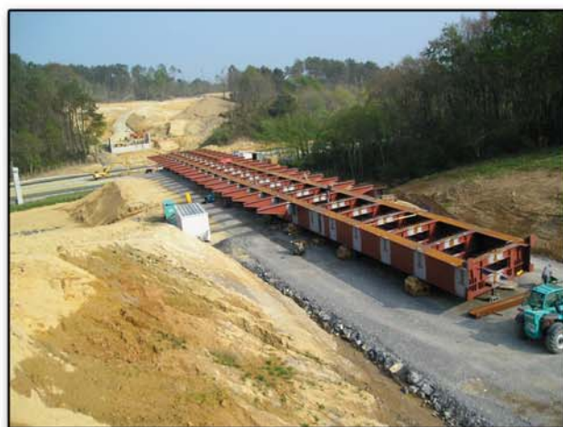
Portée : 2 travées de 45 m

C et ouvrage, de 91 m de long sur 13 m de large est situé sur la RD 85 à Ondres (Bayonne).