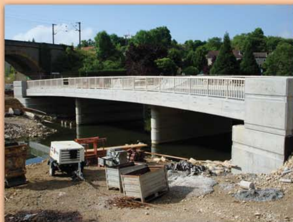
Montant du marché : 1,398 million d'euros

E ncore deux mois avant que le pont sur le Rupt de Mad ne soit reconstruit. Cet ouvrage, de type passage supérieur à dalle béton armé possède trois travées et une portée de 33 m.