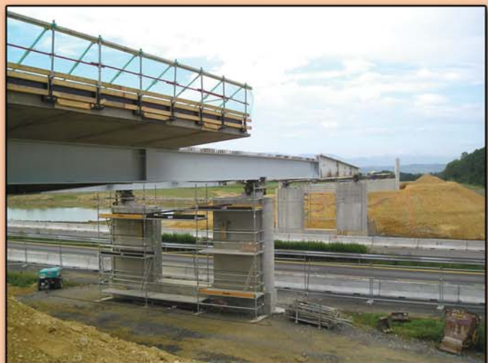
Poids acier : 90 tonnes

Les deux ensembles seront assemblés sur une plateforme puis lancés de nuit sous coupure d'autoroute A64.